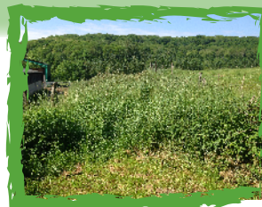
Fermeture par la végétation : le maire n'est pas obligé d'entretenir