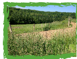
Obstacle à la circulation : le maire doit intervenir